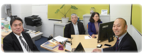
東京での無料講習会の1コマ。写真NGの方はカメラ側にいます(^-^)

東京も大阪も、場所を提供してくれ、FP事務所、少人数で和気あいあいと講習をしていますのでお気軽にお立ちください。